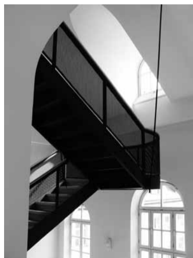
■ Alexandrastraße, Aufgang zum 5.OG