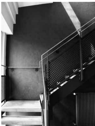
■ Liebigstraße, Aufgang zum 5.OG