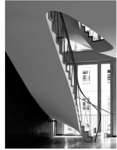
■ Liebigstraße, Haupttreppe 1.OG