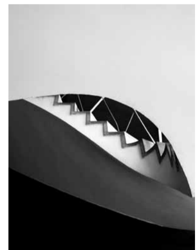
■ Liebigstraße, Haupttreppe