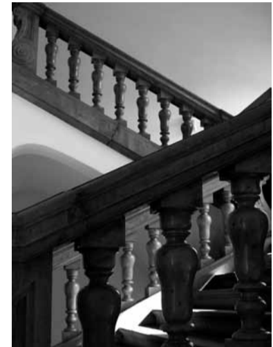
■ Alexandrastraße, Haupttreppe 4.OG