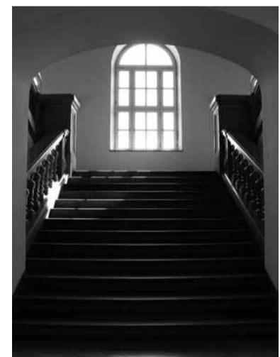
■ Alexandrastraße, Haupttreppe 4.OG

Herausgeber Landesamt für Vermessung und Geoinformation (LVG) 80538 München • Alexandrastraße 4