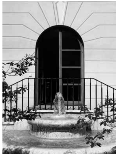
■ Alexandrastraße, Brunnenhof