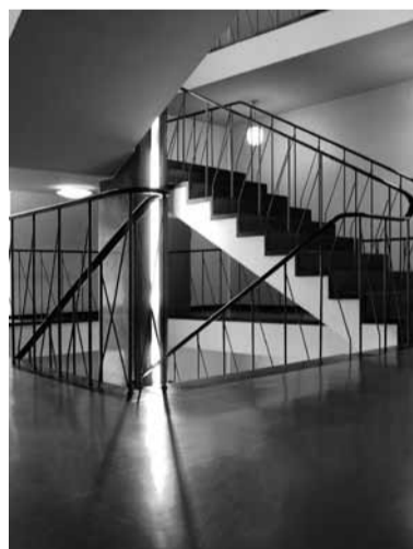
■ Liebigstraße, Lichtsäulentreppe