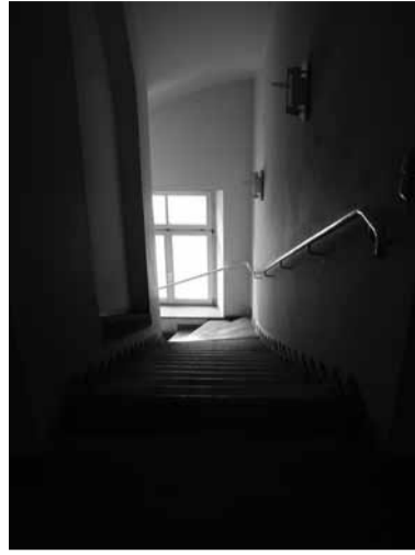
■ Alexandrastraße, südl. Seitentreppe