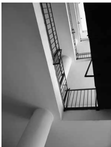
■ Oettingenstraße, Haupttreppe