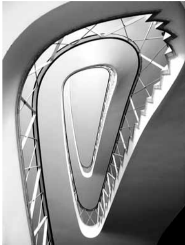
■ Liebigstraße, Haupttreppe