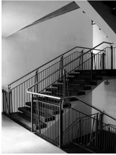
■ Oettingenstraße, Haupttreppe